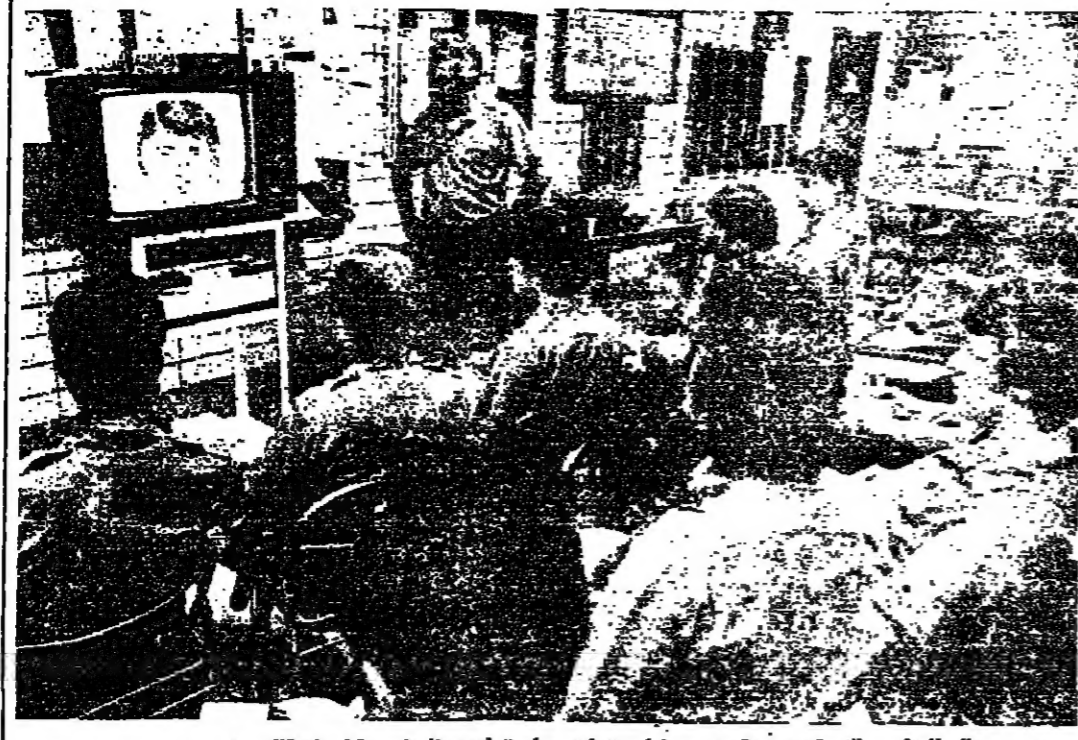
رجال البوليس المتجربون يراقبون رسماً ك - ا ب ن س م - اعداه البوليس قبل اعتقاله